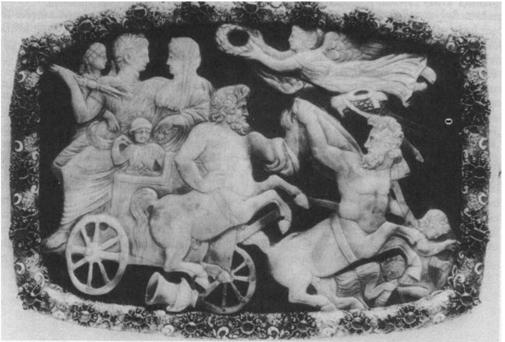
Afb. 1 De Grote Kamee van Constantijn, 315 n. Chr. (Den Haag, Kon. Penningkabinet)

Deze had juist de Grand Camée de France (thans in het Parijse Cabinet des Medailles) ontdekt. Ongeveer te zelfder tijd kwam de