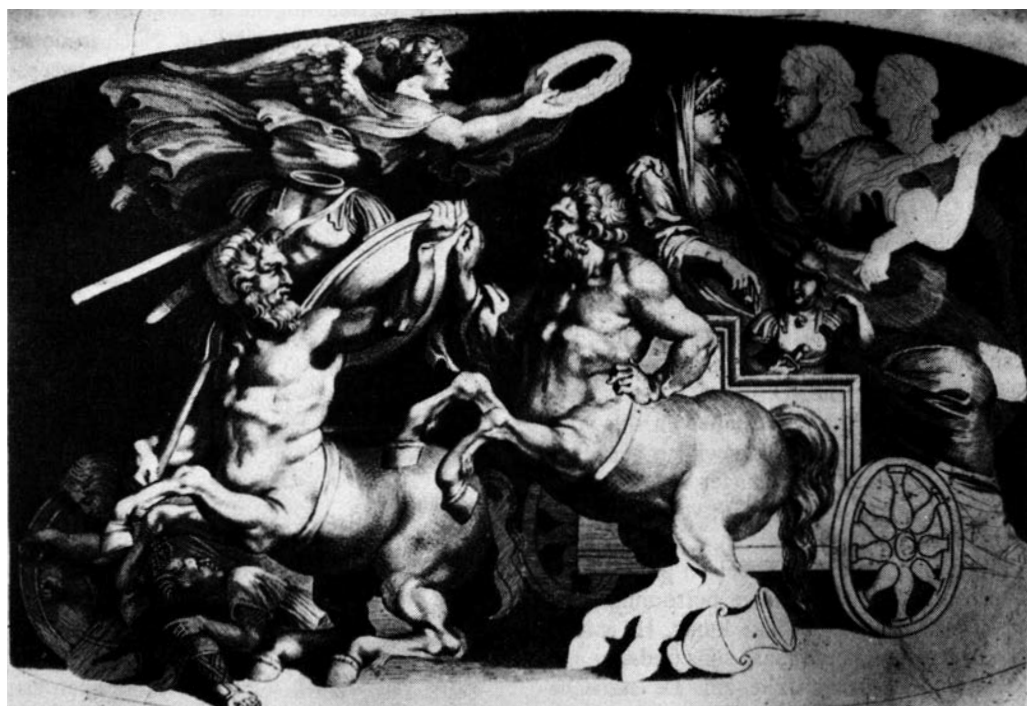
Afb. 2. Prent van Paulus Pontius naar tekening van Rubens

Het is een gelaagde agaat van uitzonderlijke grootte (21,1 x 29,7 cm). In de witte bovenlaag is de voorstelling uitgesneden, die scherp afsteekt tegen de grijs-bruine achtergrond. Voorgesteld is een echtpaar – waarvan de man door een lauwerkrans als keizer is gekenmerkt – met een kleine jongen staande op een door centauren getrokken wagen. Op de achtergrond ziet men het profiel van een oudere vrouw, die haar hand naar het jongetje uitstrekt. Onder de wagen ligt een krater omgekanteld. De voorste centaur loopt gevallen vijanden onder de voet en draagt op zijn schouders schild en trofee. Bovenaan