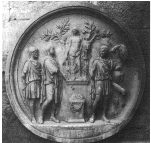
Afb. 4. Offer aan Diana.

ger is geweest van de acht tondi , blijft moeilijk te zeggen. Op de huidige plaats komen de tondi zeer tot hun recht en het zal zeker geen toeval zijn dat deze twee eeuwen later opnieuw werden gebruikt voor een openbaar monument. Kennelijk was de manier waarop Hadrianus in zijn tijd inhoud gaf aan het keizerschap in later tijden nog steeds een lichtend voorbeeld.