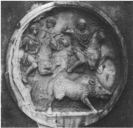
Afb. 3. Jacht op een zwijn.

Constantinus Chlorus, de vader van Constantijn, een groot voorstander van was. De noordkant heeft dan als thema de verering van Hercules.