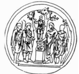
IV Offer aan Diana