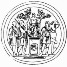
I Offer aan Apollo