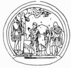
VI Offer aan Silvanus