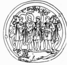
VII Rust na de Leeuwjacht