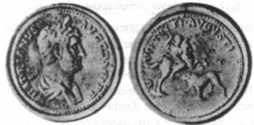
Afb. 5. Penning met als thema de 'Virtus August'.

R. Turcan, Les tondi d'Hadrien sur Larc de Constantin, CRAI , 1991, 53-82.