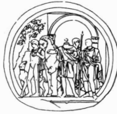
II Vertrek naar de jacht