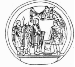
VIII Offer aan Hercules